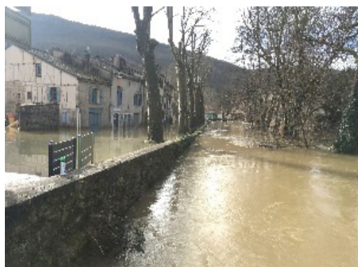
Mardi 2 février 2021 : La Bonnette en pleine crue (ci-dessus) rue de la Condamine. A droite : rue Orbes, avec le niveau d'eau en 1981 marqué sur un mur de la Rue des Claustres au fond

«La plupart des personnes ayant des liens avec St Antonin auront entendu parler de l'inondation catastrophique que la ville a subie en mars 1930 mais, bien que ce fût la pire, c'était l'une des nombreuses inondations qui ont affecté Saint-Antonin au cours des siècles. Les comptes consulaires de l'année 1362-1363 mentionnaient que les habitants étaient habitués au débordement de l'Aveyron.»