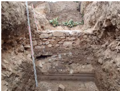
Fig. 8: Vue de l'un des murs profonds du sondage S1, vers l'ouest.

térieurs au dépôt du corps, avec une pente générale vers le nord-est, sur une trentaine de centimètres de profondeur, indiquant un affaissement. La découverte d'un petit vide à 1,40 m de profondeur nous apporte la preuve d'un soutirage dû à une cavité de nature indéterminée dans ce secteur du cimetière. Malheureusement nous n'avons pas été en mesure de mener plus loin nos recherches, et cette cavité demeure énigmatique.