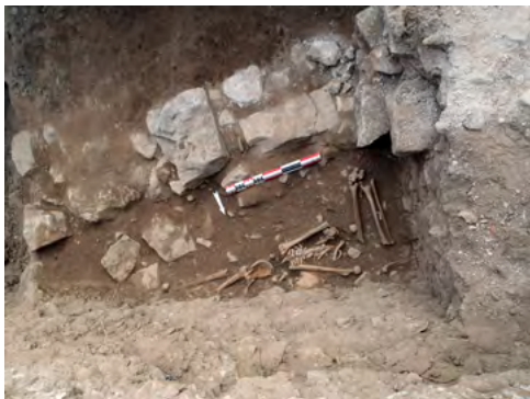
Figure 4: Vue zénithale des sépultures 106, 107 et 108 dans le sondage S1. Le mur limite l'extension sud du cimetière (vers le haut du cliché). Noter l'orientation inhabituelle nord-sud du sujet 106, à droite du cliché.

(fig. 2). Nous avons pu suivre le tracé de ces deux murs superposés sur une longueur totale de 17 m, et constater qu'ils correspondent à une limite parcellaire figurant sur le cadastre de 1811 (fig. 1). En outre, ce mur (ou une reprise de celui-ci) subsiste au moins jusqu'en 1895, date à laquelle il est photographié par A. Gallup (fig. 3).