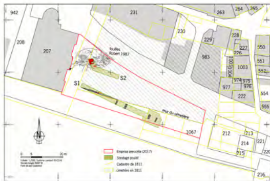
Figure 1 : Plan du diagnostic archéologique, avec implantation des sondages, localisation des fouilles de 1987-88, du cadastre de 1811 et de l'ancien cimetière (synthèse B. Poissonnier/Inrap).

Retrouvez tous ces documents en grand format sur notre site web : www.savsa.net