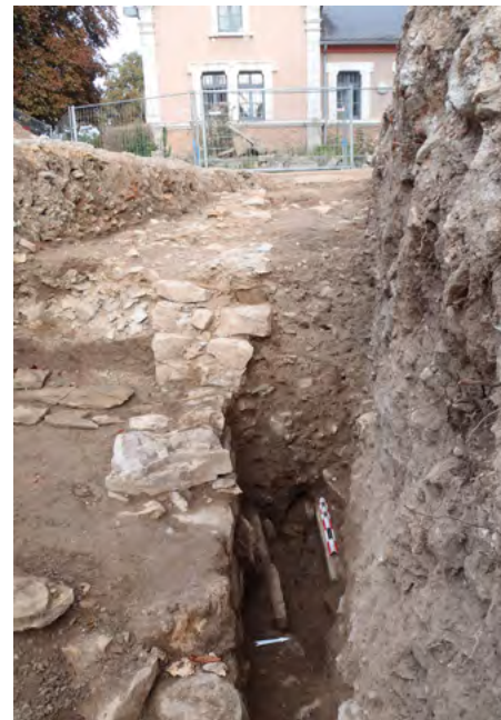
Figure 5: Même vue que la figure 2, à une phase plus avancée de la fouille. Remarquer la tombe d'enfant 112 qui apparaît en fond de tranchée à droite.

La situation au sud du mur, donc à l'extérieur du cimetière, est bien différente. La base de la reprise du mur paraît fondée au travers d'un niveau terreux, en tranchée aveugle, sur une profondeur de 0,20 m, postérieurement à 1612 au vu de la découverte d'un denier-tournois de Louis XIII émis cette année-là. Cette reprise atteste de la perdurance de