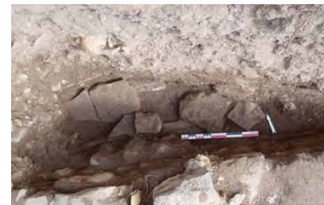
Figure 6: Apparition de la sépulture d'enfant 112 (S1) en vue zénithale. Les restes de sa couverture en dalles sont visibles.

La sépulture tout à l'est du sondage présentait des déplacements particuliers, pos-