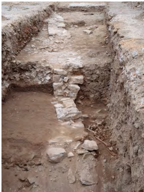
Figure 2: Le sondage S1 montrant les murs superposés du cimetière, en direction de l'ouest, avec la sépulture 109 sur la droite.

est connu assez précisément par diverses sources postérieures. Ainsi, la copie réalisée au XIXe siècle du plan représentant l'emplacement des ruines du monastère, dressé en 1760, nous est parvenue (AC Saint-Antonin, non coté; Rivals 2015, fig. 37). Bien que le plan soit assez détaillé, nous ne sommes pas parvenus à le recaler précisément sur le cadastre de façon satisfaisante: il est plus à prendre comme un croquis que comme un document aux mesures fiables. L'enclos abbatial est connu grâce à des plans du XVIIIe siècle (Arch. Dép. Tarn et G., G897; Rivals 2015, 2, fig. 43). Il est limité au sud par l'Aveyron, à l'ouest par la Bonnette, au nord par la rue de l'Hôpital Majeur et à l'est par la rue du Porche (Rivals 2015, vol. 3/2, p. 689). Sa partie sud a été aménagée en place, la Promenade des Moines.