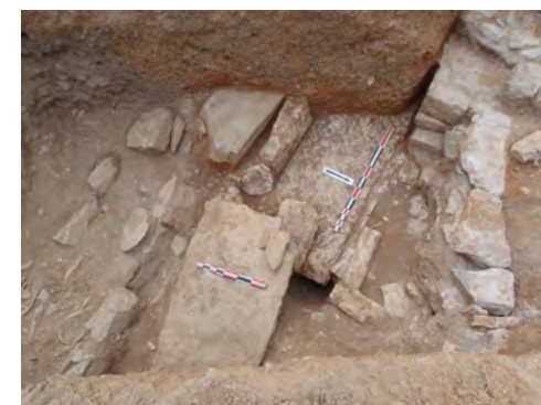
Fig. 10: Vue des grandes tombes sous dalle en fond de tranchée S2, en direction de l'ouest. La grande mire repose sur 206 et la petite sur 201.

Le cimetière se développe depuis au moins le Moyen Âge classique. Il est stratifié sur un minimum de 2,20 m d'épaisseur, et proba-