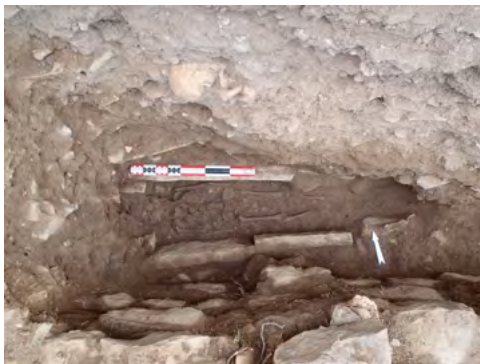
Figure 7: Sépulture d'enfant 112 (S1) en vue zénithale, avec ses aménagements en pierre, une fois ôtées les dalles de couverture.