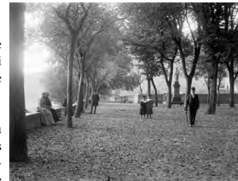
Figure 3: Vue de la Promenade des Moines (actuelle Place des Moines et son prolongement vers l'est), vers l'ouest, en 1895. Noter le mur de l'ancien cimetière (déjà démantelé à cette date), dont le diagnostic a retrouvé les fondations.

Le bâtiment thermal fut construit en 1911-1912 et la place attenante bénéficia de la construction d'un mur de terrasse agrémenté d'un escalier monumental dont le projet, retenu en 1913, fut réalisé en 1915. La grande inondation de 1930 verra l'effondrement du mur de terrasse et la ruine de la balustrade d'origine en calcaire. L'ensemble sera cependant reconstruit pratiquement à l'identique en 1931, mais avec une balustrade en ciment. D'excellentes comparaisons visuelles